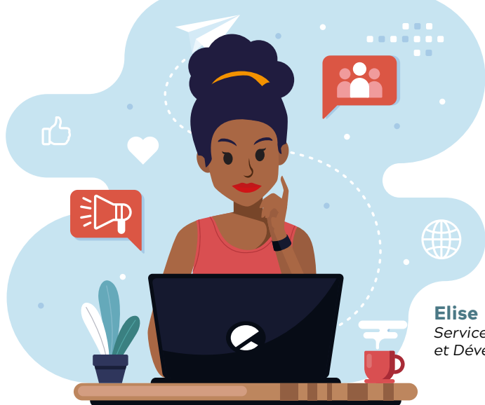
Elise Service Recherche et Développement